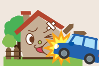
建物外部からの 落下・衝突等 または、建物内部での 車両の衝突・接触