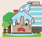
給排水設備の 事故等による水ぬれ