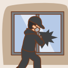
盗難による き損・汚損