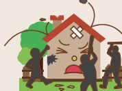
騒乱・集団行動 による破壊

最高 1億円 までの加入金額となります。 ※特殊物件割増の一般造は8,000万円 または4,600万円が限度額となります。