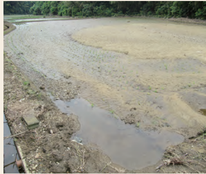
土砂の流入した水田